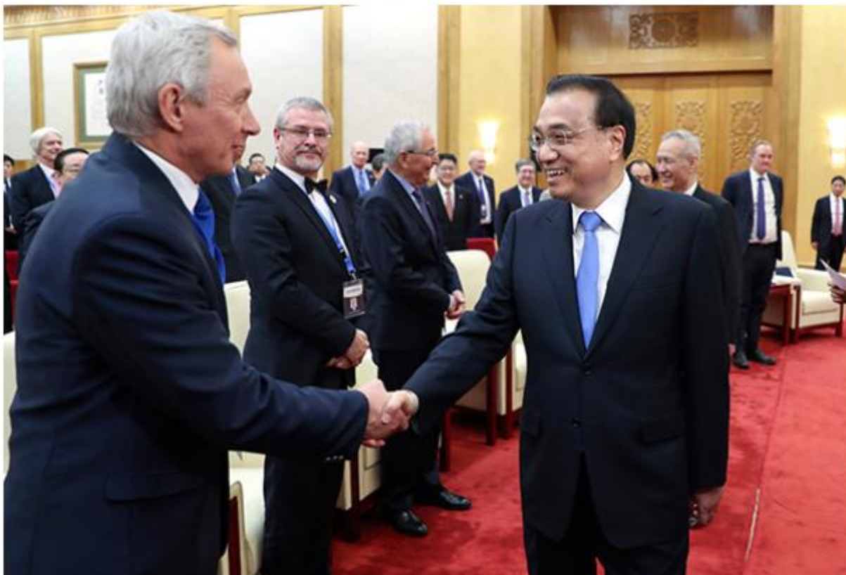
Begrüßung der Experten durch Premierminister Li Keqiang